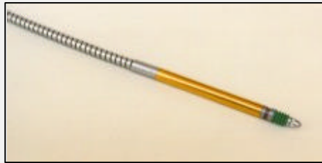
Messtaster mit bewehrtem Kabel